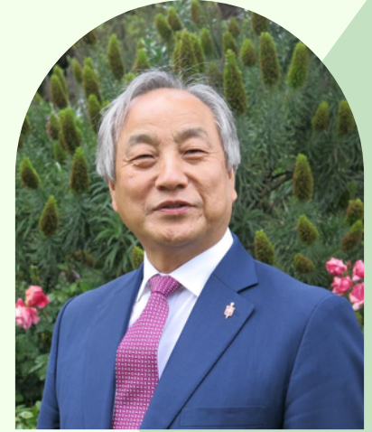
정희수 감독 BISHOP HEE-SOO JUNG

정희수 감독은 연합감리교회 감독으로 북일리노이 연회(2004-2012)와 위스콘신 연회(2012-2024)를 섬기고 현재 오하이오 감독구(East Ohio Conference/West Ohio Conference) 주재 감독으로 섬기고 있습니다.